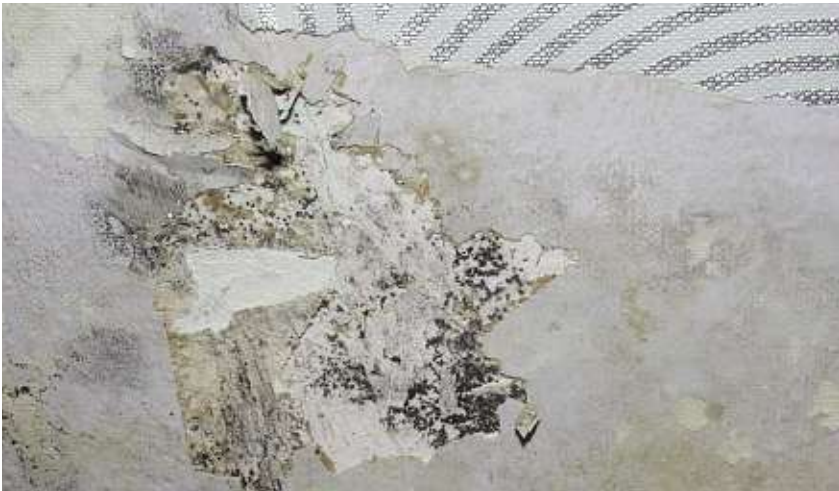
Küf mantarından oluşan lekeler örnek

Önemli: Bizim üzerinde durduğumuz konular, özel durumlarda hukuki danışma yerine geçmez. Bu nedenle kiracı ve ev sahibinin, şüpheli durumlarda, hukuki hak ve sorumlulukları hakkında, vakit geçirmeden avukatlarıyla veya hukuk danışmanlığı veren kuruluşlarla görüşerek bilgi almaları gerekir. Danışmanlık veren kuruluşlar olarak, örneğin Kiracı Dernekleri [“Mietervereine”], Emlak ve Arazi Sahipleri Dernekleri [“Haus- und Grundeigentümergevereine”] bu konuda yardımcı olabilir.