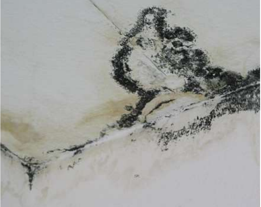
Küf mantarından oluşan lekeler örnek

Eğer evde küf mantarı olduğu kesinleşirse, hemen bu sorunun giderilmesi için harekete geçmek ve tadilata başlamak gerekir. İç mekanlardaki küf mantarı oluşumları küçük de olsa, sağlığımızı korumak için yok edilmelidir. Sadece küf mantarını temizlemek, eğer sebepler de ortadan kaldırılmıyorsa, bir anlam ifade etmez. Çünkü er veya geç yine küf mantarları ortaya çıkacaktır. Bu nedenle, küf mantarlarının sebeplerinin, özellikle de içeriye giren nem miktarının artması konusunun, mutlaka açıklığa kavuşturulması gerekir.