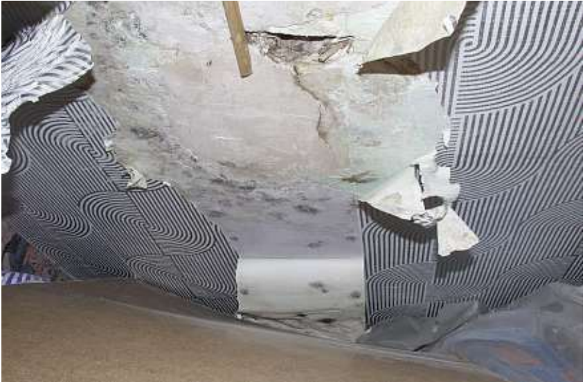
Duvar kağıdı arkasında oluşmuş küf mantarı

Küf mantarları, eğer bir madde belli bir miktarın üzerinde nem içeriyorsa, onu üreyebilecekleri mekan olarak seçerler. Burada söz konusu olan, maddenin toplam nemi değil, sadece küf mantarlarının işine yarayacak şekilde kullanılabilir nem miktarıdır. Küf mantarları, görünüşte ıslak olmayan malzemeler üzerinde veya içinde de yetişebilir. Malzemenin yüzeyinde yaklaşık %80 oranında bir bağıl nem olması yeterlidir. Özellikle malzemenin yüzeyinde veya içerisinde su buharından çiy damlacıkları oluşuyorsa, küflenmeye elverişli ortam mevcut demektir.