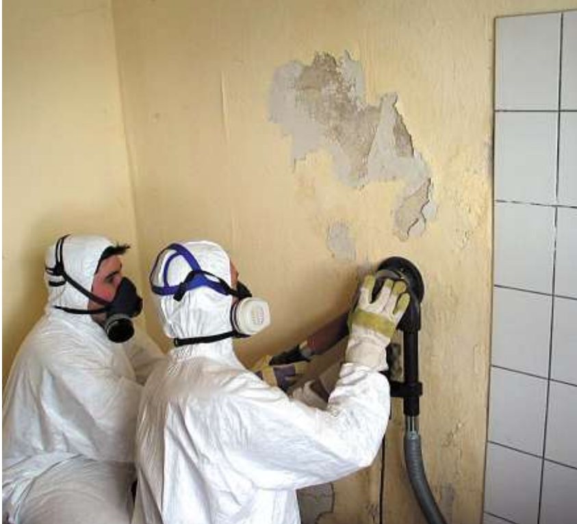
Bir evdeki tadilat ve tamirat işleri