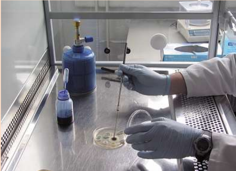
Laboratuvarda küf mantarı tespiti

Evinizdeki küf mantarlarından kaynaklanmış olabileceğini düşündüğünüz sağlık sorunlarınız varsa, cilt doktorunuza, bir çevre sağlığı merkezine ["Umweltmedizinisches Zentrum"] veya Eyalet Tabipler Odası Birliği'ne ["Landes-Ärzttekammer"] başvurabilirsiniz.