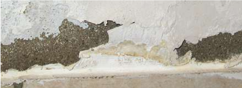
Soğuk ve nemli duvarlar, mantarların üremeleri için en elverişli ortamlardır

Binanın inşaatı sırasındaki ihmallerden ileri gelen hata ve eksikliklerin yanısıra, binada oturanların da iç mekanlardaki rutubet artışına katkıları olduğunu biliyoruz. Evlerin bilinçsizce yanlış havalandırılması veya günlük yaşamda çok rutubete sebep olan işler (mesela yıkanmak, yemek pişirmek, çamaşır yıkamak, evde büyük akvaryumlar bulundurmamak vs.), binalardaki nem oranının normalin üstüne çıkmasına neden olabilir. Bu özellikle de, eğer bina enerji tasarruf etmek amacı ile çok iyi bir ısı yalıtımı ile donatılmış ise, bir problem olarak karşımıza çıkar.