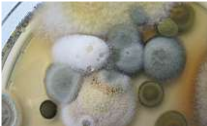
Havadan alınan örneklerden laboratuvarıda yetiştirilmiş küf mantarı kültürleri

Ancak bu yabancı madde ile temasın tekrarlanması halinde, vücutta nezle, hapşırık, gözlerde kızarıklık, ciltte kızarma ve kabarma gibi tipik alerjik sonuçlara yol açan, bir dizi tepkiler oluşabilir. İç mekanlarda küf mantarları nedeni ile ortaya çıkan sağlık sorunlarına dair belirtiler çeşitlidir. Bunların en sık görülenleri örneğin gözlerde, burun içinde ve boğazda yanma hissi ve öksürük, baş ağrısı veya yorgunluk halidir. Küf mantarlarının sebep olduğu enfeksiyonlar, çok ender olarak ve hastalıklar nedeni ile bünyesi zayıflamış veya aşırı hassas insanlarda görülebilir. Hem canlı, hem de ölü küf mantarları alerjilere veya tahrişlere sebebiyet verebilir. Ancak enfeksiyonlara sadece canlı küf mantarları yol açabilir.