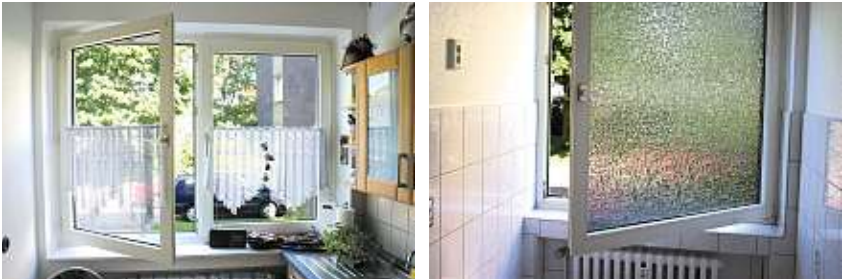
Pencereyi kısa süreli tam açarak hava değişiminin sağlanması

Burada önemli olan, mekanlarda neme sebep olacak işler görüldükten sonra (insanların havaya verdikleri rutubet, yıkanma, yemek yapma, çamaşır yıkama vs.) bu nemin düzenli havalandırma ile dışarı atılmasını sağlamaktır.