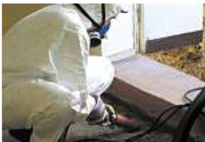
Bir evin küften arındırılması

Duvar kağıtları ve fayanslardaki silikonlu ek yerleri küflenmişse, yerlerinden sökülmeleri, küflenmiş yüzeylerin nemli bezle silindikten veya ince toz filtrelili (HEPA, High Efficiency Particulate Air Filter) bir elektrik süpürgesi yardımı ile temizlendikten sonra, yanma ve parlama tehlikeleri göz önünde bulundurulmak (mümkün olduğunca az miktar kullanılmalı, oda iyice havalandırılmalı, sigara içilmemeli, ateş yakılmamalı) ve iş kazalarından korunma kurallarına uymak (koruyucu eldivenler, ağız maskesi, koruma gözlükleri) koşulu ile, %70-80'lik etil alkolle dezenfekte edilmeleri en doğru yoldur.