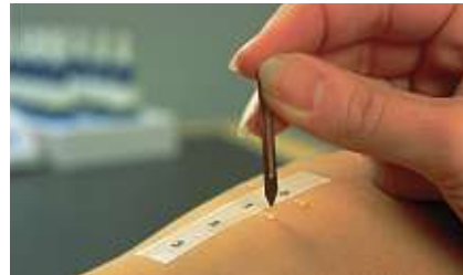
Alerji testi uygulaması